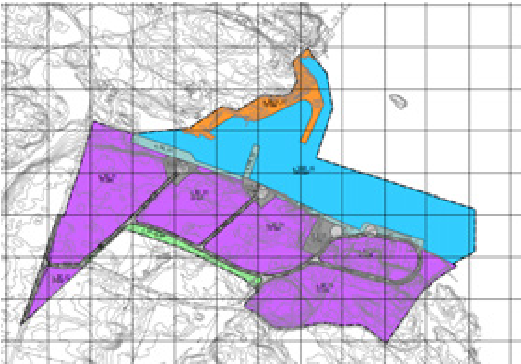
Planavgrensning og arealformål.