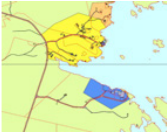
Nåværende kommuneplan 2007 – 2019